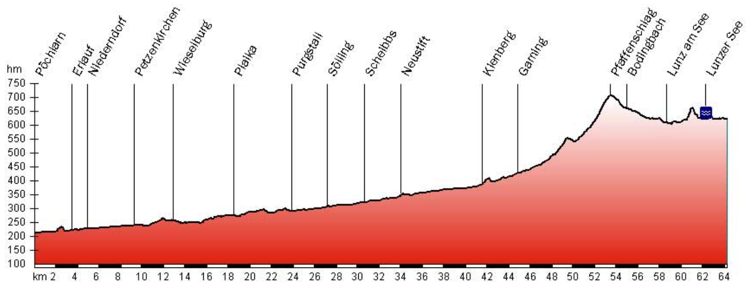
Ötscherland-Radweg Region Mostviertel 62 Kilometer 656 Höhenmeter Profil: leicht bis mittel

Bemerkungen: Familien und Hobbyfahrer fahren mit der Bahn bis Kienberg Gaming und mit dem Rad gemütlich bis nach Pöchlarn zurück oder auch umgekehrt.